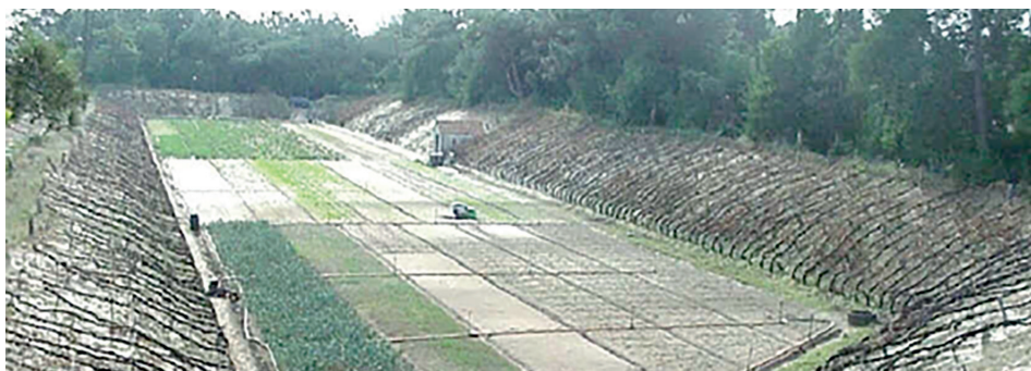
Um bonito campo-masseira, uma relíquia do passado