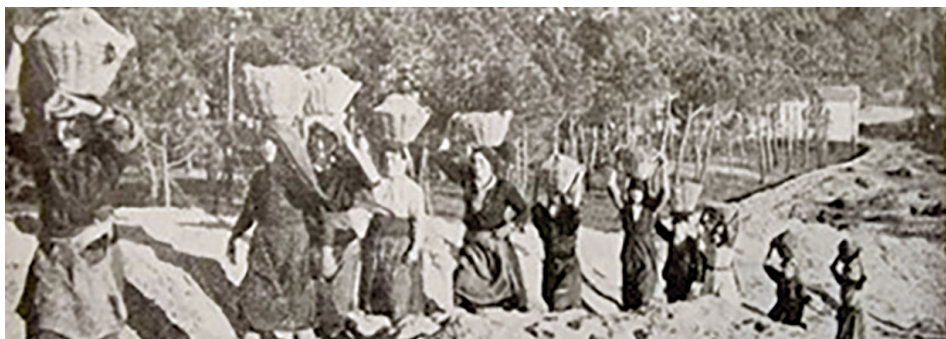
Um aspecto da “descoberta” de um campo-masseira